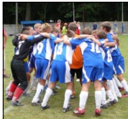
RTP Unia Racibórz – Slavia Opava 3:1 (1:1)

Po pasjonującym meczu, który licznie zgromadzoną publiczność trzymał w napięciu od początku do końca, ręce w geście triumfu podnieśli zawodnicy z Raciborza, którzy przechylili szalę zwycięstwa na swoją korzyść w ostatnich trzech minutach gry.